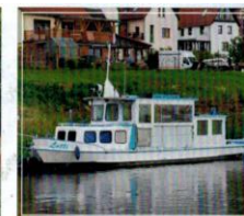
historisches, ehemaliges Fährboot